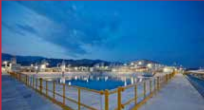
30 İlklerin adresi: Kızıldere 3 Jeotermal Enerji Santrali...