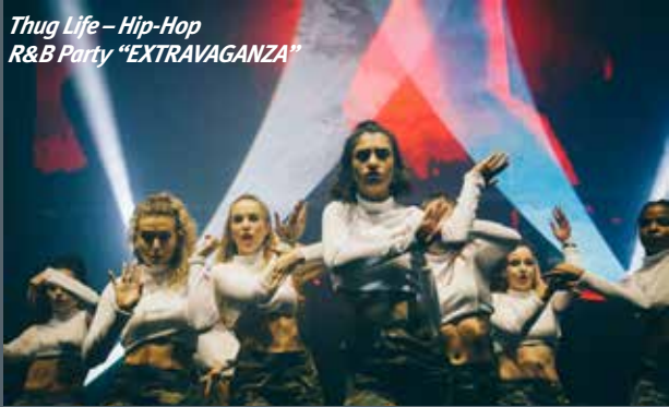
Thug Life – Hip-Hop R&B Party “EXTRAVAGANZA”