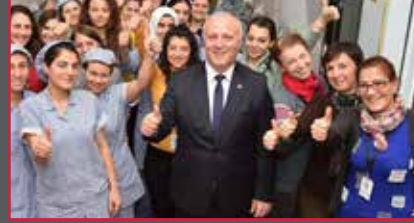
13 Zorluteks, sürdürülebilir çalışma koşullarıyla fark yaratıyor