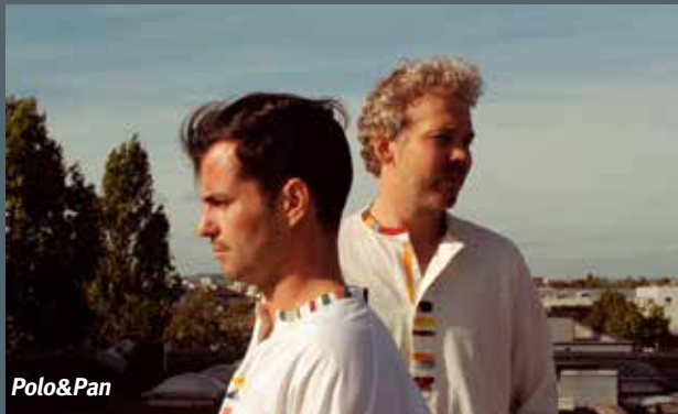
Polo & Pan