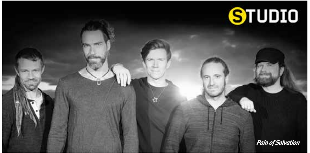
Pain of Salvation

Her sezon daha da güçlendirdiği altyapısı ve çeşitlendirdiği programıyla sanatseverlerin beğenisini kazanan Zorlu Performans Sanatları Merkezi, kültür sanat hayatına yön vermeye devam ediyor.