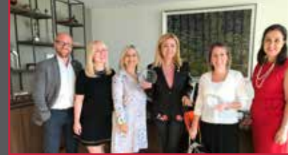
17 Zorlu Center'ın "Zorlu'da Engel Yok" projesine ICSC Foundation'dan ödül...