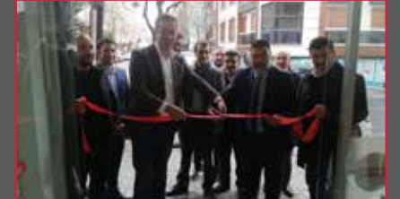
62 Türkiye'nin ilk engelsiz yetkili servisi

Renk Ayırımı ve Basım SNS Tanıtım Cengiz Topel Cad. Tuğcular Sok. No:1, Etiler/İstanbul Tel: (0212) 287 7234