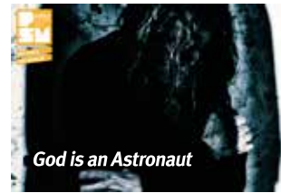
God is an Astronaut

7 Aralık 2018'de ise ülkesinin kuzeybatısından getirdiği downtempo melodileri tüm dünyaya yayan Fakear ve Türkiye'de online müzik dinleme servislerinde en çok dinlenen isimlerinden olan Cléa Vincent, peşpeşe performanslarıyla Zorlu PSM'de XXF: Very Very French Festival 2018 serisini unutulmaz bir geceyle taçlandırdı.