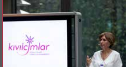
46 Zorlu Grubu'nda gönüllülük hareketi Kıvılcıklar'la başladı