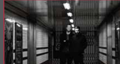
48 Zorlu PSM 2019'da da iddialı