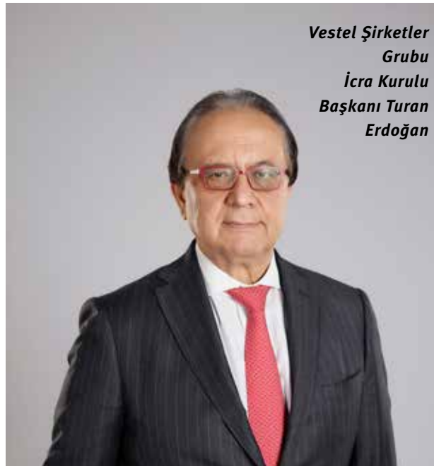
Vestel Şirketler Grubu İcra Kurulu Başkanı Turan Erdoğan

Vestel'in son teknoloji ürün ve hizmet çözümleriyle iş ortaklarına fayda sunma ilkesinin bir yansıması olarak hayat bulan ekranlar sayesinde, insan trafiğinin en yoğun