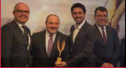
12 Vestel Elektronik'e çevre alanında Avrupa ve Türkiye'den çifte ödül!