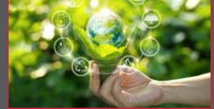
22 Zorlu Enerji üçüncü kez BİST Sürdürülebilirlik Endeksi'nde!